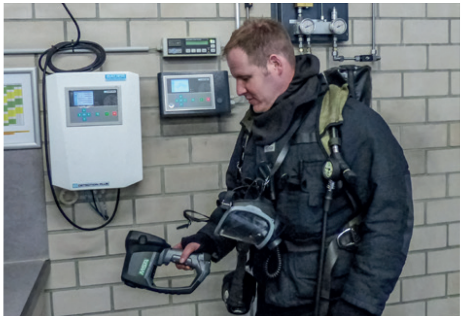
Für eine hundertprozentig sichere Atemluftqualität verlässt man sich bei der Feuerwehrschiele Würzburg auf eine Luftmessung mit dem Onlinegasmesssystem B-DETECTION PLUS von BAUER KOMPRESSOREN.

Steigende Umweltbelastungen und strengere Grenzwerte bei Schadstoffen verlangen heute nach Systemen, die verlässliche lückenlose Messungen der in der Umgebungsluft enthaltenen Schadstoffe ermöglichen. Gleiches gilt für Gase, die in industriellen Produktionsprozessen erzeugt werden. Bei BAUER wurde dieser Bedarf bereits früh identifiziert und mündete in einen intensiven, langjährigen Entwicklungsprozess. Mit dem gewonnenen Know-how im Sensorikbereich konnten die BAUER Ingenieure mit B-DETECTION PLUS ein Gasmesssystem entwickeln,