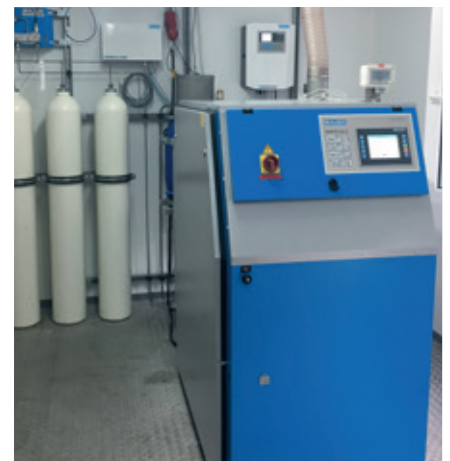
Bei der Firma Rehn GmbH in Hamburg steht eine der modernsten Atemluftabfüllstationen Deutschlands - überwacht von B-DETECTION PLUS!

Diese Aufgabe übernimmt das Online-Gasmesssystem B-DETECTION PLUS. Es protokolliert die Messwerte, speichert sie als Logdaten geräteintern ab und verschafft dem Betreiber so