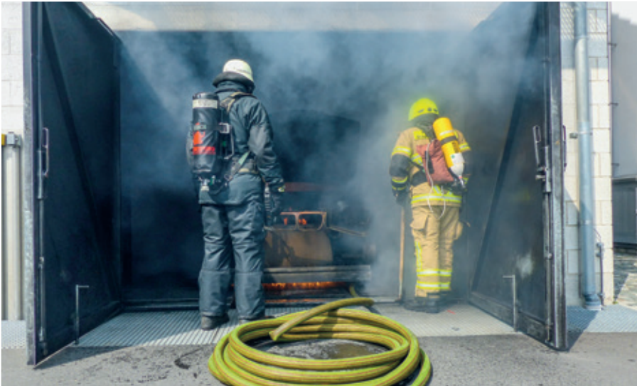
Lehrgangsteilnehmer üben bei der Feuerwehrscheule Würzburg realitätsnah unter schwerem Atemschutzgerät den Löscheinsatz.

dige zuverlässige Versorgung mit großen Mengen hochreiner Atemluft sichern vier schallgedämmte, leistungsstarke Hochdruckkompressoren von BAUER. Immerhin durchlaufen während der ca. 70 Lehrgänge pro Jahr knapp 1.300 Teilnehmer ein Übungsprogramm, bei dem die Teilnehmer und Ausbilder täglich 50 Flaschen Luft verbrauchen. Der weltweit steigende Anteil von CO 2 in der Atemluft, lokal noch durch die Kesselanlage von Würzburg verschärft, stellt die Verantwortlichen der Feuerwehrscheule zunehmend vor die dringliche Aufgabe, die Einhaltung der Grenzwerte der DIN EN 12021:2014 zu kontrollieren und rechtssicher zu dokumentieren.