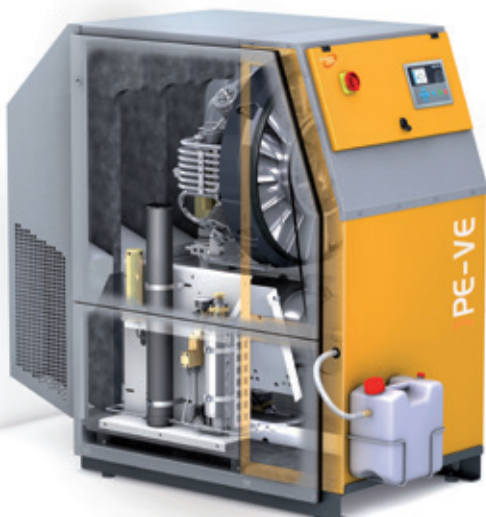
Der neue PE-VE Industrie besticht durch ein hervorragendes Preis-Leistungs-Verhältnis.