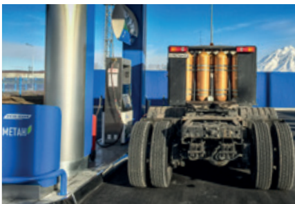
Ein CNG-betriebener LKW beim Befüllen an der neuen Tankstelle in Petropawlowsk

Es gibt nur wenige Orte auf der Erde, die so abgelegen sind wie die russische Stadt Petropawlowsk im sibirischen Kamtschatka. Abgeschnitten vom normalen Straßennetz ist sie nur per Flugzeug oder Schiff erreichbar. Der Ostküste der Halbinsel grenzt an die Beringsee. Extreme Wetterbedingungen, die von Tiefsttemperaturen im sibirischen Winter bis zu warmen Temperaturen im kurzen Sommer reichen, und die isolierte Lage stecken die Rahmenbedingungen für den Betrieb von technischem Gerät vor Ort. Entsprechend lautet hier die Maxime: „kompromisslose Zuverlässigkeit“! Aus diesem Grunde kam