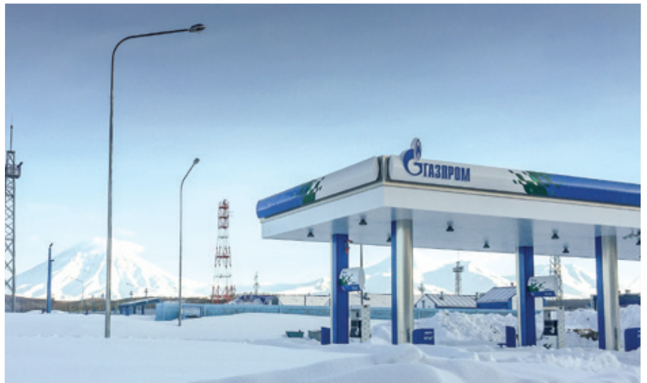
Auch unter arktischen Bedingungen mit Schnee und extremer Kälte versehen BAUER Anlagen zuverlässig ihren Dienst – der Grund, warum der Weltkonzern Gazprom auf die Technik des Marktführers im Bereich Hochdruckverdichtung vertraut.

BAUER KOMPRESSOREN zum Zuge, als im Rahmen eines russischen Erdgastankstellenprogramms vor fünf Jahren die Errichtung mehrerer leistungsstarker schlüsselfertiger Erdgastankstellen in Sibirien, darunter als östlichster Standort Petropawlowsk, ausgeschrieben wurde. Die endgültige Inbetriebnahme der Station musste nach erfolgreichem Abschluss der Installation und Übergabe noch bis zur Anbindung ans entstehende Erdgasnetz aufgeschoben werden.